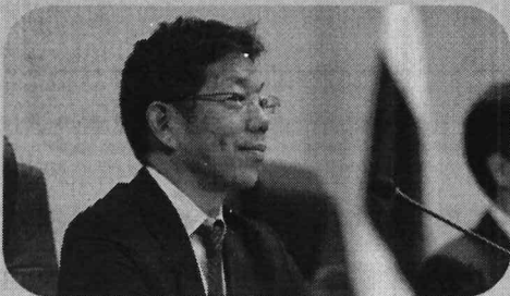
นายคะจิواره โทรุ (Mr. KAJIWARA Toru) อัครราชทูตและหัวหน้าฝ่ายเศรษฐกิจจาก Embassy of Japan in Thailand

กล่าวเปิดการสัมมนาโดยเน้นย้ำถึงความสำคัญของการส่งเสริม การจ้างงานผู้สูงอายุและความร่วมมือระหว่างองค์กรปกครองส่วนท้องถิ่น ของไทยและญี่ปุ่น ภายใต้บริบทสังคมผู้สูงอายุโดยชี้ว่าการสนับสนุน ให้ผู้สูงอายุยังคงมีบทบาทในสังคมจะช่วยยกระดับคุณภาพชีวิต กระตุ้นเศรษฐกิจท้องถิ่น และเสริมสร้างความเข้มแข็งของชุมชน ทั้งนี้ ความร่วมมือระหว่างท้องถิ่นของทั้งสองประเทศ รวมถึง การดำเนินงานของอาสาสมัครจาก JICA มีบทบาทสำคัญ ในการแลกเปลี่ยนองค์ความรู้และแนวปฏิบัติที่ดี ตลอดจนสนับสนุน การพัฒนาด้านสาธารณสุขและสวัสดิการผู้สูงอายุในระดับพื้นที่ อันจะนำไปสู่การขยายความร่วมมือไทย - ญี่ปุ่นอย่างยั่งยืนในอนาคต